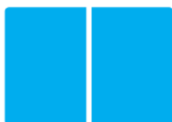
Rozkładówka (420 mm x 297 mm) 1000 zł