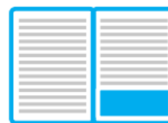
¼ poziom (210 mm x 74,25 mm) 150 zł

W przypadku zamówienia artykułu sponsorowanego lub wywiadu sponsorowanego cena usługi wynosi 70% ceny klasycznej reklamy .