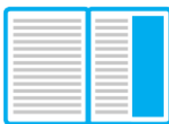
½ pion (105 mm x 297 mm) 300 zł